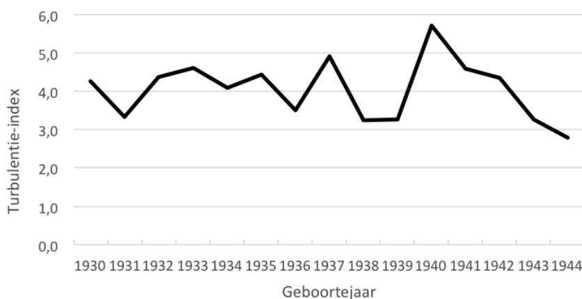
Figuur 3 Gemiddelde complexiteit naar geboortejaar